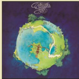
WPCR-18562 ¥3,080 (税込) 1972年作品

新たにキーボードの魔術師リック・ウェイクマンが加入して黄金期のメンバー構成となった 4 作目。全 9 曲中メンバー 5 人のソロ曲が含まれる変則的な構成になっているものの、どれも個性豊かでクオリティも高く、ロック史における名盤の 1 枚となっている。シングル「ラウンドアバウト」が大ヒットし、世界中にイエスの名を知らしめた記念碑的な作品。ロジャー・ディーンによる美麗アートワークにも注目が集まった。ワーナー・パイオニア盤オリジナル LP の A 式見開きジャケットを可能な限り再現。8p カラー・ブックレットを再現封入。オリジナル解説インサートを 4/5 の縮小サイズにて再現封入。日本盤オリジナル LP 帯を復刻。ブックレットには曲目解説、歌詞、新規対訳を掲載。