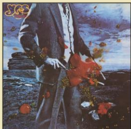
WPCR-18570 ¥3,080 (税込) 1978 年作品

世界的なパンク・ムーヴメントの潮流を受け、プログレッシヴ・ロックから離脱したイエスのオリジナル 9 作目。シンフォニックな要素は完全に姿を消し、社会問題を取りあげたり SF ブームに反応した楽曲を作るなど、イエスの歴代作品の中で最もヴァラエティに富んだ内容となった。捕鯨問題を取りあげたヒット・シングル「クジラに愛を」や、クリス・スクワイアによる美しい叙情詩「オンワード」などを収録。ワーナー・パイオニア盤オリジナル LP の A 式シングル・ジャケットを可能な限り再現。オリジナル歌詞カードとオリジナル解説インサートを 4/5 の縮小サイズにて再現封入。日本盤オリジナル LP 帯を復刻。ブックレットには曲目解説、対訳を掲載。