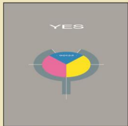
WPCR-18572 ¥3,080 (税込) 1983年作品

3年ぶりに活動を再開し、装いも新たにメインストリーム・ロック・シーンへと返り咲いたイエスのオリジナル11作目。新たに若きギタリストのトレヴァー・ラビンが加入し、ジョン・アンダーソンやトニー・ケイといったオリジナル・メンバーが復帰、トレヴァー・ホーンがプロデュースするなど、様々な才能が結集した大ヒット作となった。全米 No.1 を獲得した「ロンリー・ハート」や「リーヴ・イット」などのヒット曲を収録。ワーナー・パイオニア盤オリジナルLPのE式シングル・ジャケットを可能な限り再現。オリジナル歌詞カードとオリジナル解説インサートを4/5の縮小サイズにて再現封入。日本盤オリジナルLP帯を復刻。ブックレットには曲目解説、対訳を掲載。