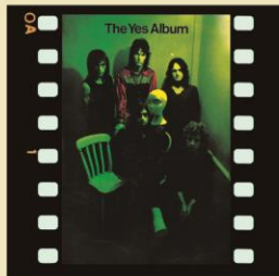
WPCR-18561 ¥3,080 (税込) 1971年作品

ピーター・バンクス の脱退を受け、スーパー・ギタリストのステイヴ・ハウが加入し、イエス黄金期への布石となった 3 作目。エディ・オフォードが共同プロデューサーとして加わり、この後に開花するイエス・サウンドの第一歩が刻まれている。シングルカットした「アイヴ・シーン・オール・グッド・ピープル」、ライブでの定番曲「ユアズ・イズ・ノー・ディズグレイス」や「スターシップ・トゥルーパー」などを収録。ワーナー・パイオニア盤オリジナル LP の A 式見開きジャケットを可能な限り再現。オリジナル歌詞インサートを 4/5 の縮小サイズにて再現封入。日本盤初回発売時のロック・エイジ・マーク付帯と普及帯とのリバーシブル帯を採用。ブックレットには曲目解説、新規対訳を掲載。