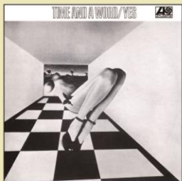
WPCR-18560 ¥3,080 (税込) 1970年作品

前作と同メンバーで作られたセカンド・アルバム。ロック、ポップ、ジャズのエッセンスをミックスした方向性はそのままに、フル・オーケストラを導入してロックとクラシックの融合を試みた意欲作。演奏はよりパワフルになり、アレンジもより複雑さを増している。リッチー・ヘヴンスとバッファロー・スプリングフィールドのカヴァーを収録。ワーナー・パイオニア盤オリジナルLPのA式シングル・ジャケットを可能な限り再現。オリジナル解説・歌詞インサートを4/5の縮小サイズにて再現封入。日本盤オリジナルLP帯とロック・エイジ・マーク付帯とのリバーシブル帯を採用。ブックレットには曲目解説、対訳を掲載。