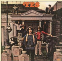
WPCR-18559 ¥3,080 (税込) 1969年作品

イエスのデビュー・アルバム。バンド創設者のジョン・アンダーソンとクリス・スクワイアは、骨太のロックとハーモニー・コーラスが融合した新しい音楽作りを目指していた。荒削りながらも親しみやすいメロディーや複雑な曲構成などは、すでにイエス・ミュージックの本質を捉えている。プログレッシヴ・ロック誕生前夜の輝かしき記録。ビートルズやザ・バーズのカバーも収録した、若きアイデアが溢れる秀作。日本で最初に発売された日本グラモフォン盤LPのA式見開きジャケットを可能な限り再現。日本グラモフォン盤オリジナル帯とワーナー・パイオニア盤LP帯とのリバーシブル帯を採用。ブックレットには曲目解説、歌詞・対訳を掲載。